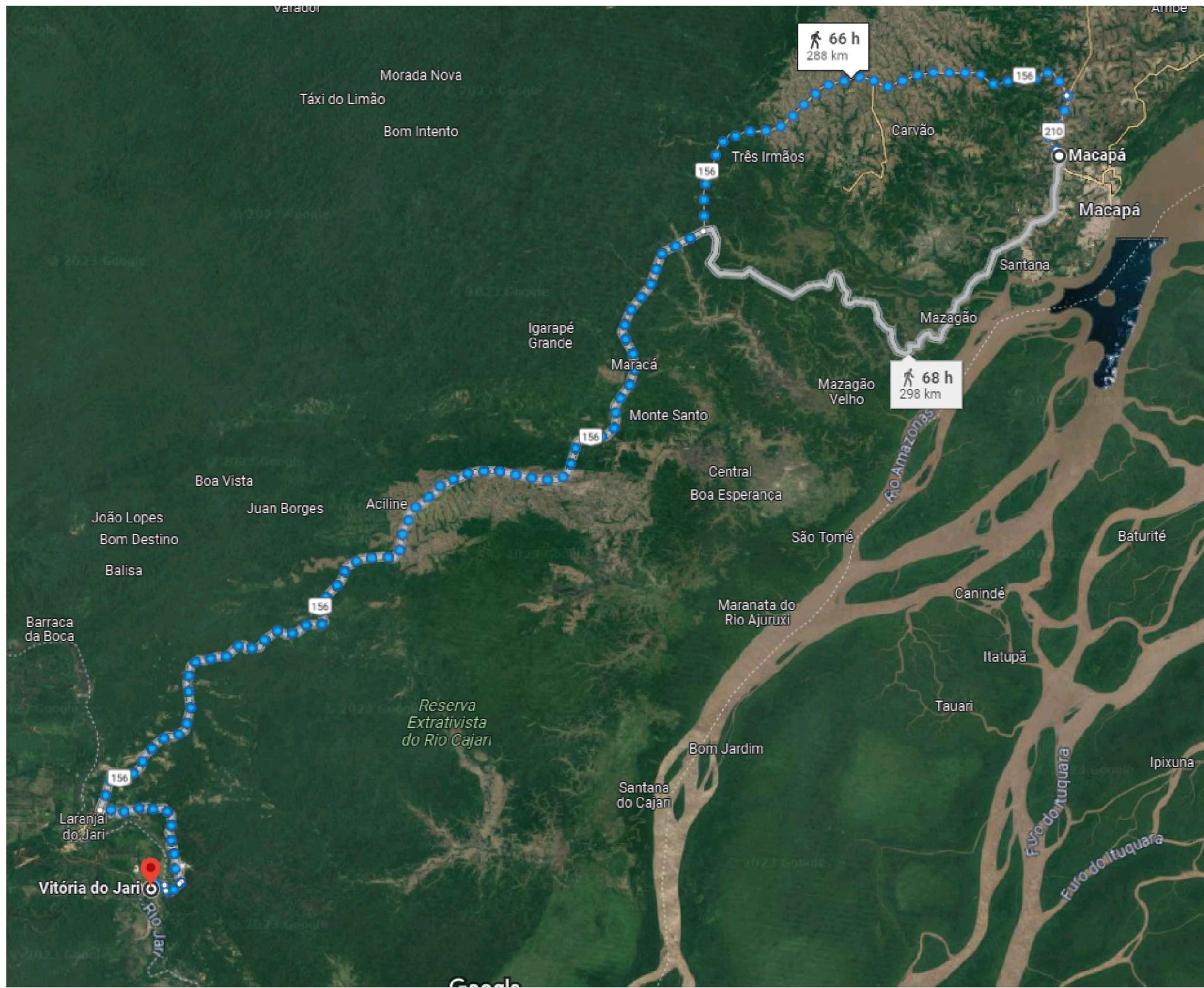
1 DMT - MACAPÁ - VT. JARÍ - 298 KM